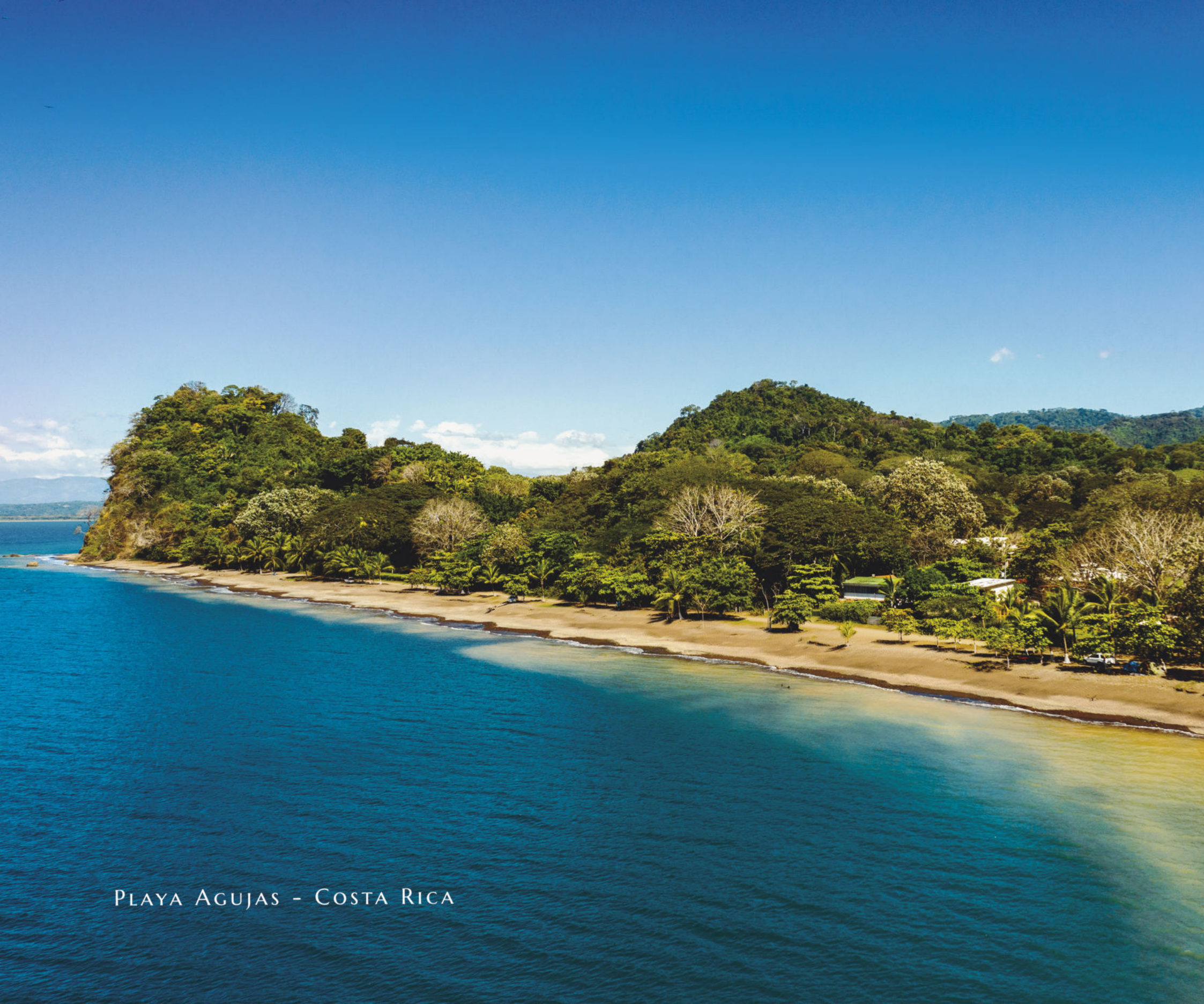
PLAYA AGUJAS - COSTA RICA